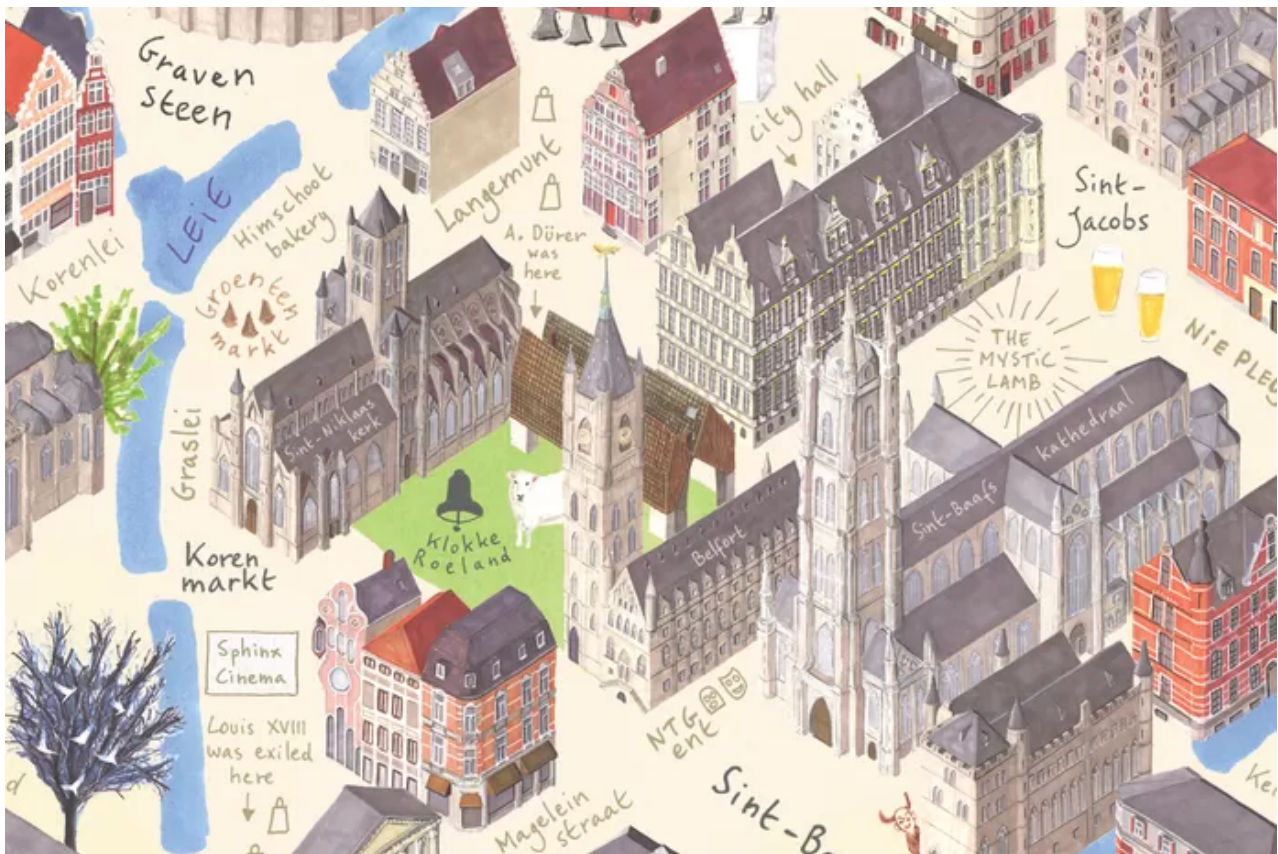
Gent Getekend - project van Karen Van Holm