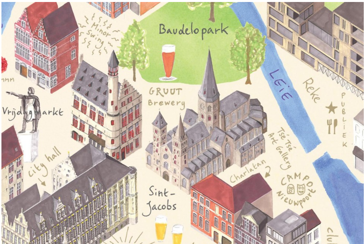
De kaart telt meer dan 150 gebouwen.