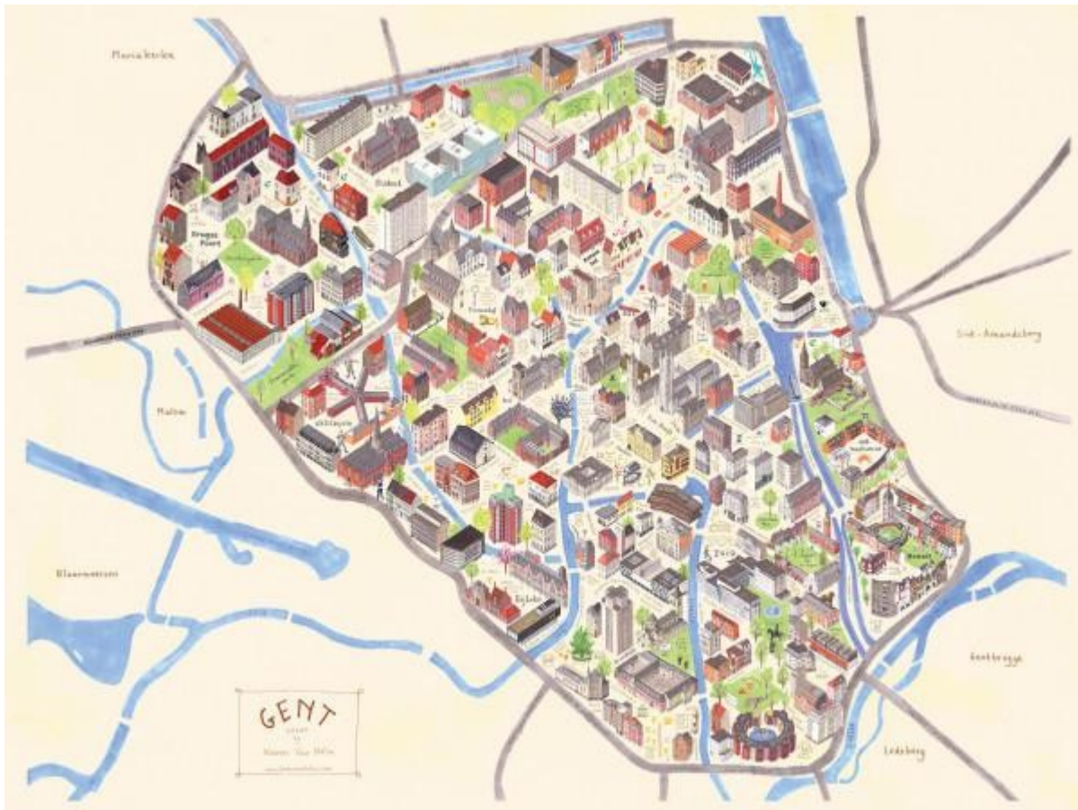
De kaart van Gent.

Karen woont zelf niet ver van de Visserij. Wie haar buurt op de kaart bekijkt, ziet vreemd genoeg een kakkerlak. “Een inside joke”, verklapt de grafisch ontwerpster. “Onlangs leidde een verwaarloosd huis in onze straat tot een kakkerlakkenplaag. De kaart toont Gent zoals ik het zie, dus krijgen zij ook een plaatsje. (lacht)”